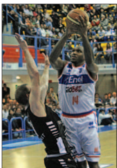
Enel Brindisi-Bologna