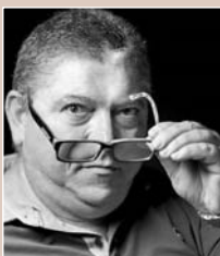
rubrica a cura di Pino De Luca

dovrà cuocere rimanendo rosata all'esterno, la salsiccia non deve essere forata per nessuna ragione, il liquido deve essere d'essudazione. Verso la fine della cottura disporre due o tre foglie di alloro nella casse-