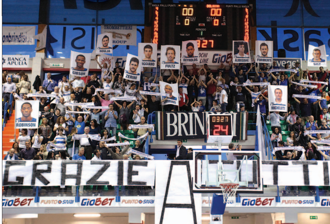
Enel Brindisi-Oknoplast Bologna 87-93

OGNI LUNEDI' "TERZO TEMPO" SU BLUSTAR TV E BLUSTARTV.IT